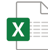
表頭: Q16【主使用】最初の購入きっかけ 表側: 主使用ブランド ※出現全ブランド