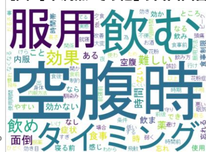
【図4】不満「その他」の自由回答