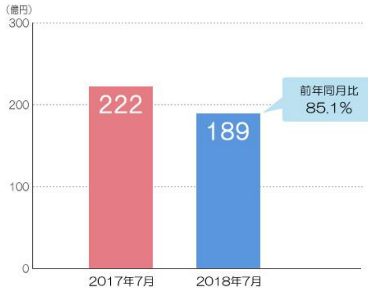
殺虫剤の販売金額

7月の殺虫剤の売上は189億円、前年同月比85.1%という低調な結果となりました。このうち虫よけ対策商品の売上は40億円で、前年同月比83.3%でした。